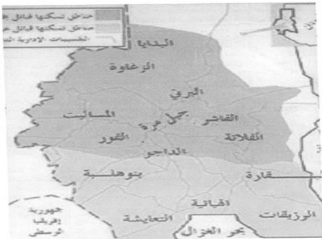
التوزيع القبلي في دارفور (خريطة تقريبية)