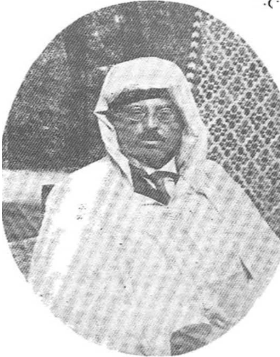
الرائد الاسلامي الكبير عطوفة الأمير شكيب أرسلان باللباس الوطني المغربي