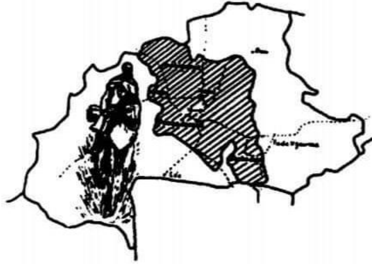
خريطة توضح أكثر الأماكن انتشاراً ونقوذاً للكنيسة في بوركينا فاسو بشكل عام