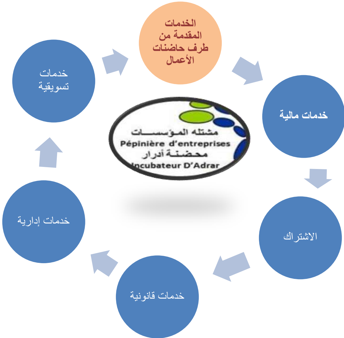
الشكل رقم 03: الخدمات المقدمة للمؤسسات الناشئة من قبل حاضنات الأعمال 1