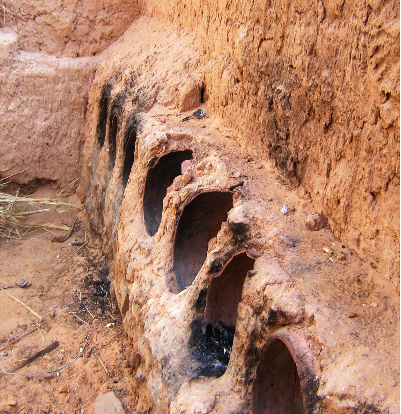
الصورة: مكان مخصص لطهي الطعام بالزاوية