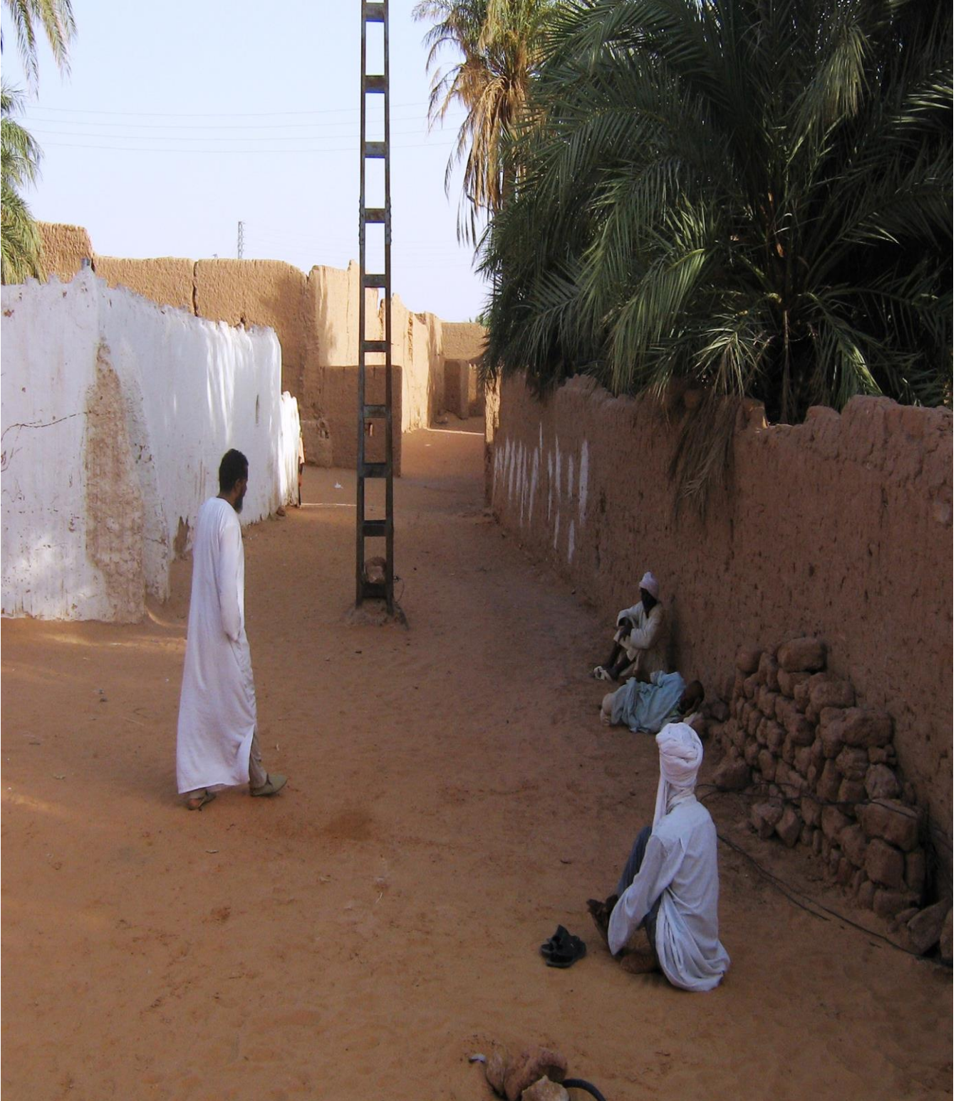
الصورة تمثل أحد أحفاد الشيخ الصوفي يقف في رحبة الزاوية