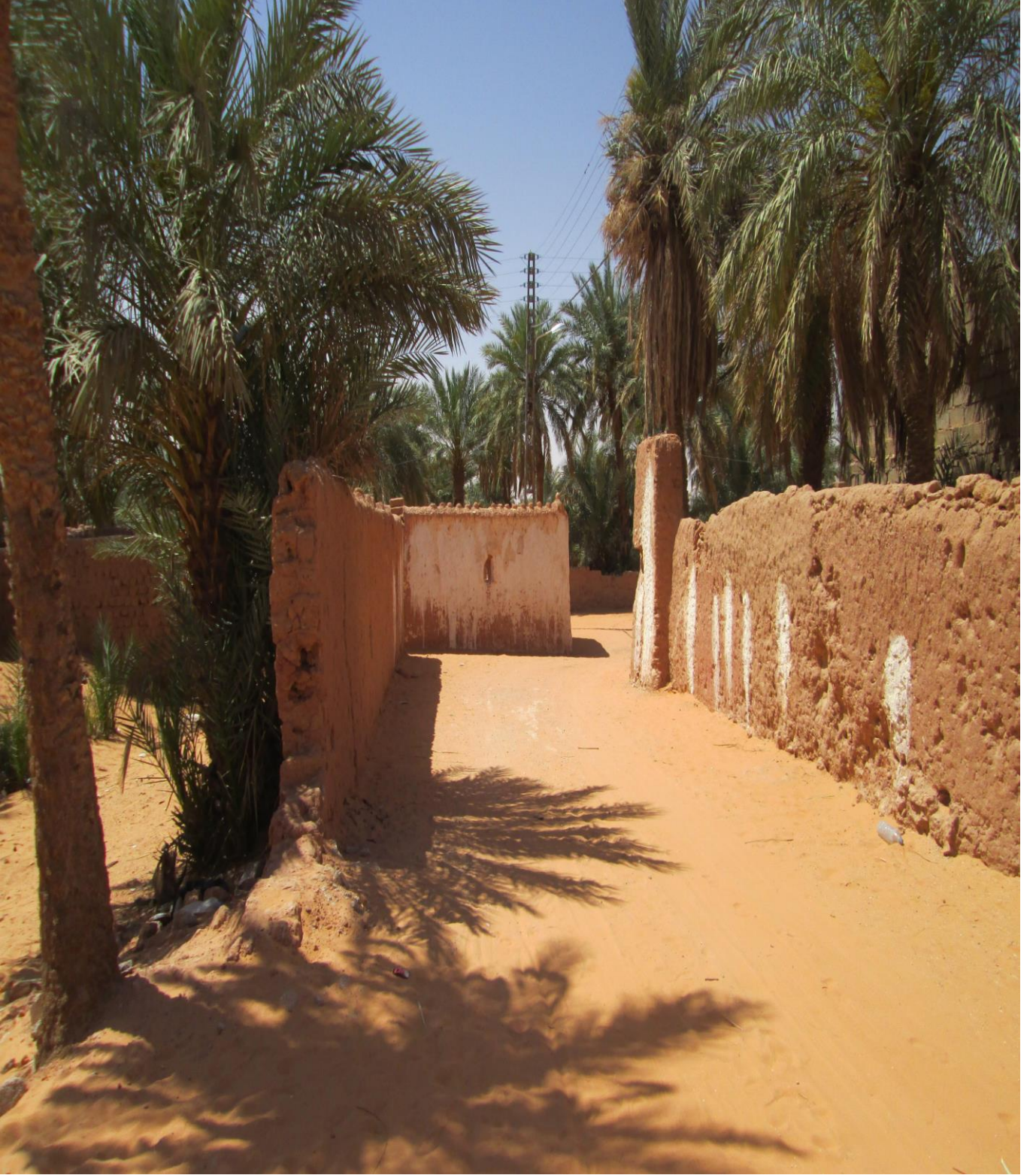
الصورة تمثل أزقة زاوية بدریان