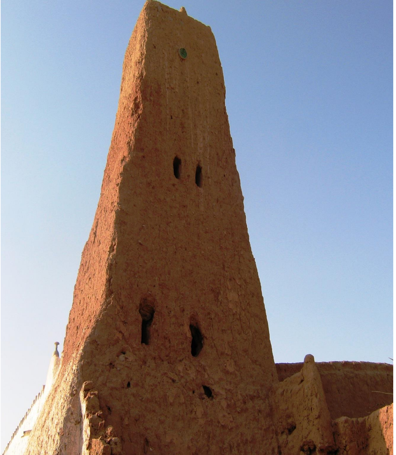
الصورة: تمثل سمعة مسجد بأدریان